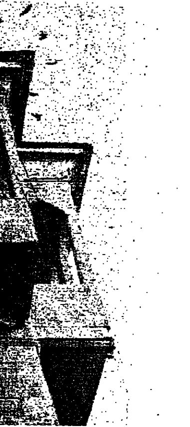
طير الحي .. من الموصل

ان يضمن عمله « الفوتوغرافي » وجهة نظر في الطبيعة او الانسان او المجتمع . في الموصل - بالعراق - عرض الفنان نور الدين حسين مجموعة من اعماله في التصوير الفوتوغرافي حيث اقام حوارا بين العين السحرية للطبيعة والعين السرية لعنسة الكاميرا . . . ومن هناك ، هذه المجموعة من المشاهدات والملاحظات والصور . . .